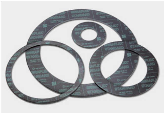
↑ Dichtungen aus SIGRAFLEX STANDARD