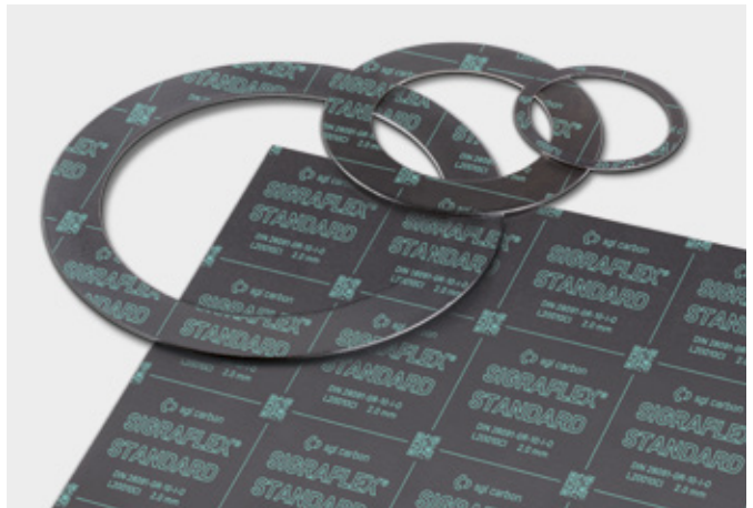
↑ SIGRAFLEX STANDARD Dichtungsplatten und Dichtungen